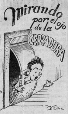
CUIDE SUS CINCO